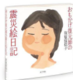
『おもかげ復元師の震災絵日記』 笹原留似子/著 ポプラ社

「いのち輝くとき」をテーマに、 子どもたちにも伝わるお話をしてい たきます。サイン会も実施します。