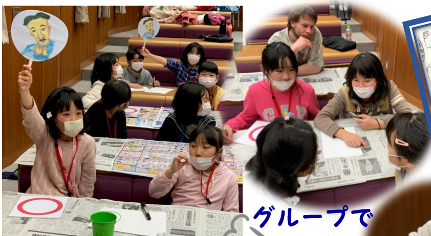
グループで 相談中！