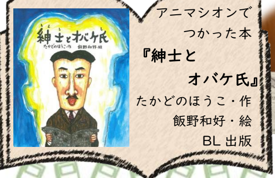
アニメーションで つけた本 『紳士と オバケ氏』 たかどのほうこ・作 飯野和好・絵 BL 出版

続いて、大好評のぶどうのつるリース作りです！今回も、地域の農家さんがご厚意でぶどうのつるリースを人数分用意してくださいました。それぞれの家から飾りたいものを準備し、図書館でも紙のバラやモールやリボンを用意しました♪みんな目を輝かせながら材料を選び、リース作りスタートです！