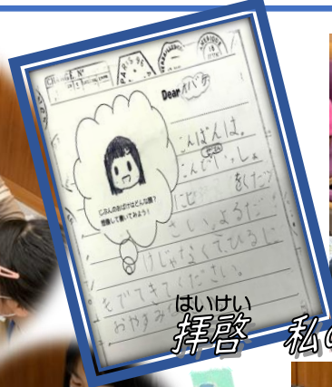
拝啓 私のおばけ様…